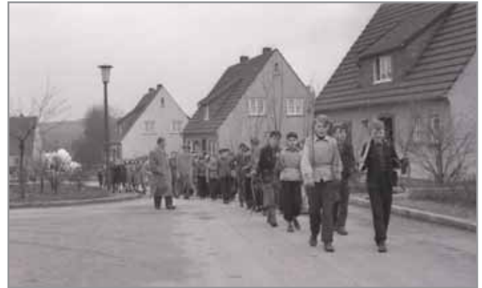
Viele Menschen aus Langschede und Ardey waren mit Schaufel und Jungpflanzen unterwegs.