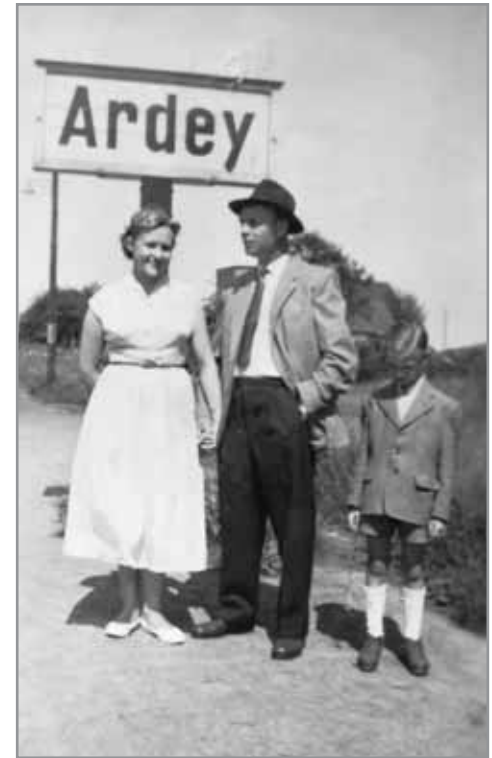
Ankommen in Ardey - natürlich am Bahnhalttepunkt.