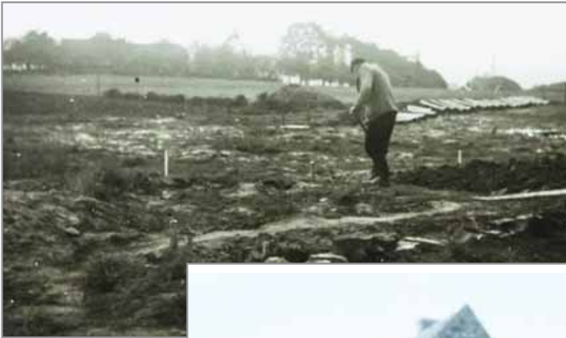
Foto oben: 1957 wurde noch viel per Hand mit der Schaufel gear- beitet - hier der Blick von Westen auf die heutige Schlesiersiedlung.