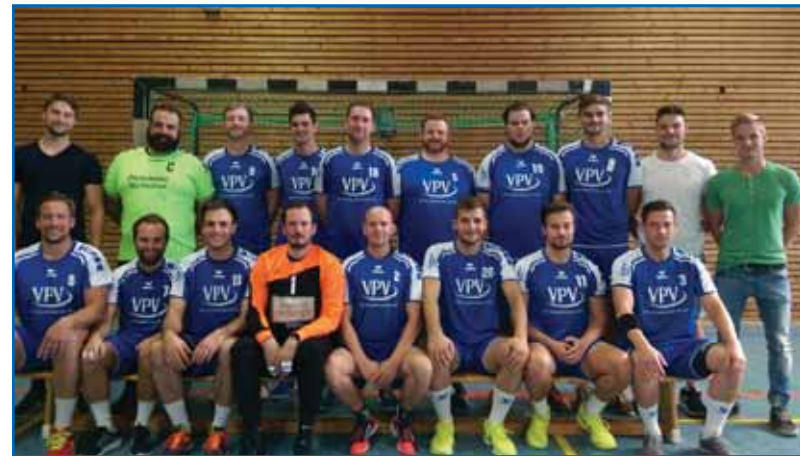
Arbeitseinsatz auf dem Tennisplatz (oben li.), Herrenmannschaft 2016(oben re.), das Trainerteam 2017 (unten li.) und und Tobi mit dem Nachwuchs (unten re.)