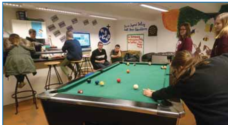
Zu Hause oder unterwegs - mit der evangelischen Jugend ist immer was los..